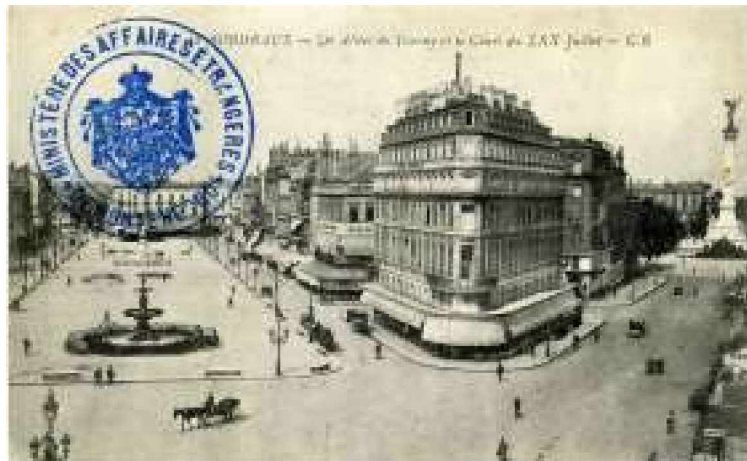
Bild 2 Ansichtskarte von Bordeaux mit Stempel des montenegrinischen Außenministeriums

Mit dieser Exilstation war die französische Regierung aber nicht einverstanden, weshalb die montenegrinische Exilregierung im März 1916 nach Bordeaux verlegt wurde (Bild 2).