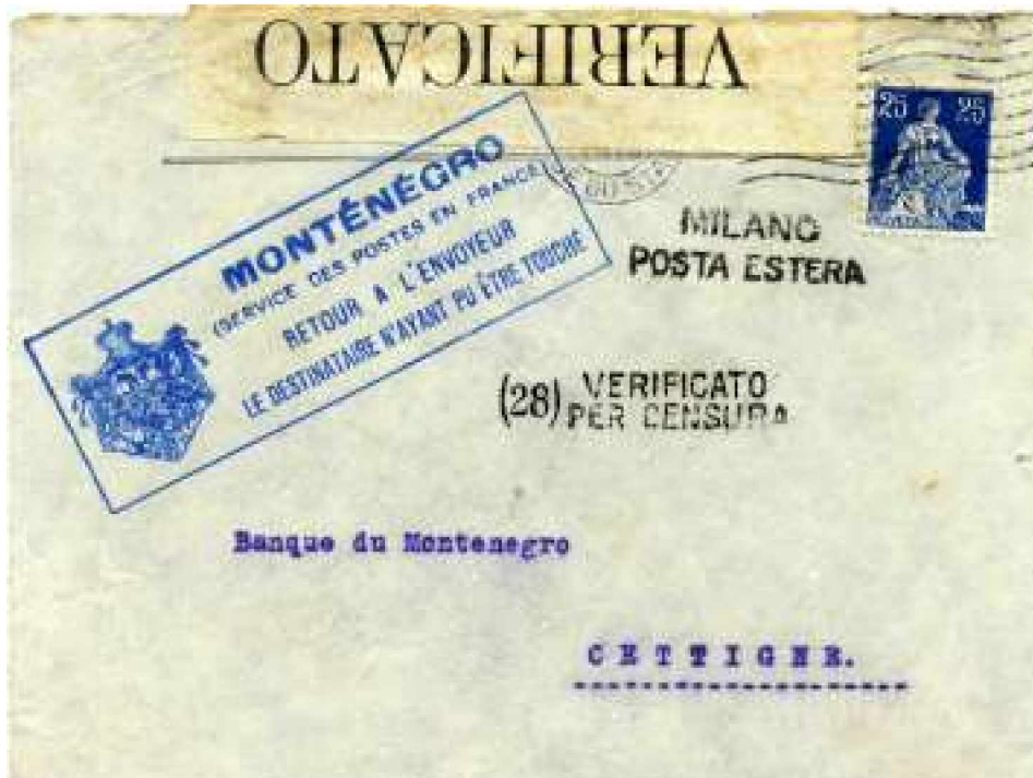
Bild 6 Rückgesandter Brief aus Genf vom 10. Januar 1916

Auch wurden Klebezettel mit diesem Stempel hergestellt, obwohl dafür kein unbedingter Bedarf vorhanden war, da der Stempel meist direkt auf die Postsendungen aufgeschlagen werden konnte. Höchstens für sehr dunkle Umschläge wäre ein solcher Klebezettel angebracht gewesen. Vermutlich hat man aber, um die postalische Verwendung zu dokumentieren, einen Teil der Post mit solchen Aufklebern versehen. Bild 7 zeigt eine solche Verwendung. Der Brief aus Russland passt in die Zeit, ob er aber wirklich über Bordeaux gelaufen ist und dort seinen Aufkleber erhalten hat, lässt sich nicht mit Gewissheit sagen. Es ist der Einzige mit Gummistempel-Klebezettel versehene Brief, der dem Autor zur Kenntnis kam.