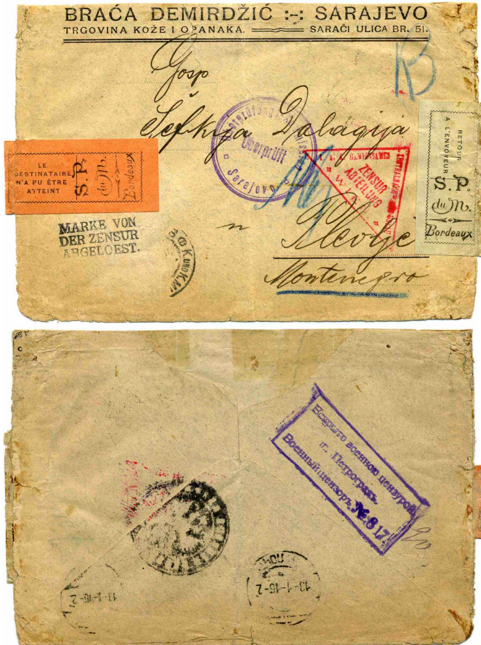
Bild 8 Vorder- und Rückseite eines Retourbriefes von Sarajevo nach Plevlje (Montenegro)

Einen aus der Literatur bekannten Retourbrief hat Vladimir Fleck im Neuen Handbuch der Briefmarkenkunde Heft 5 Montenegro gezeigt. Dieser Brief ist dadurch besonders interessant, dass er nicht aus den verbündeten oder neutralen Ländern sondern aus dem feindlichen Österreich-Ungarn stammte. Er soll hier zusammen mit seiner Rückseite abgebildet werden (Bild 8), woraus sich der ungewöhnliche Weg des Briefes erkennen lässt.