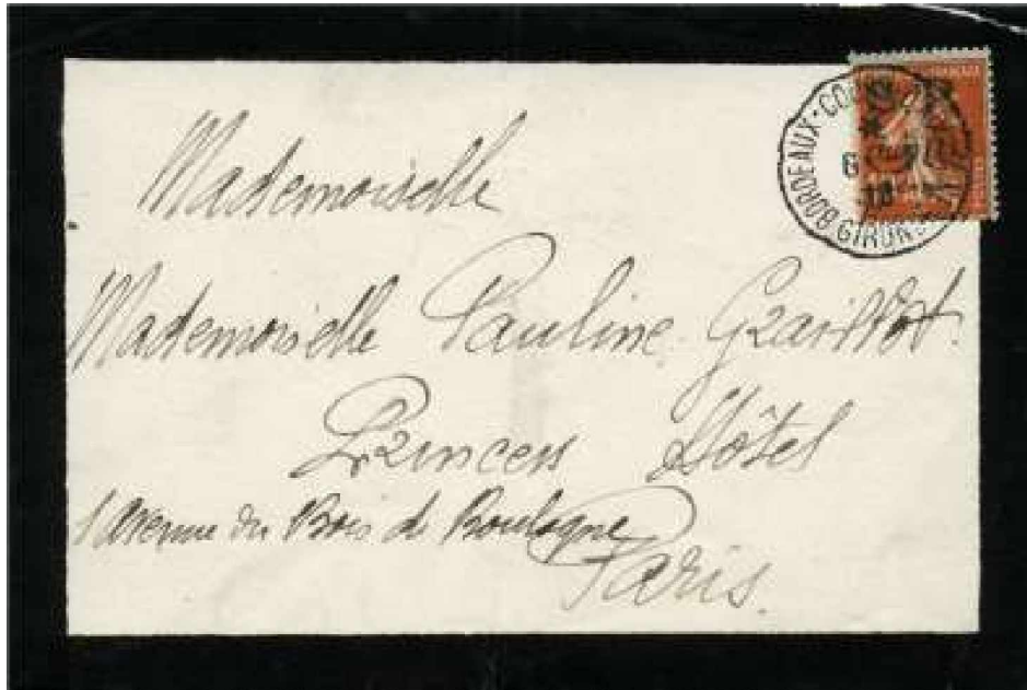
Bild 12 Brief mit montenegrinischer Dienstmarke am 6. Juni 1916 von Bordeaux nach Paris gesandt

Durch die nur dreiwöchentliche Verwendungszeit sind sehr wenige echt gelaufene Briefe mit montenegrinischen Überdruckmarken erhalten geblieben. Einen Trauerbrief mit der 10 c. Marke, der von Bordeaux nach Paris gelaufen ist, zeigt Bild 11.