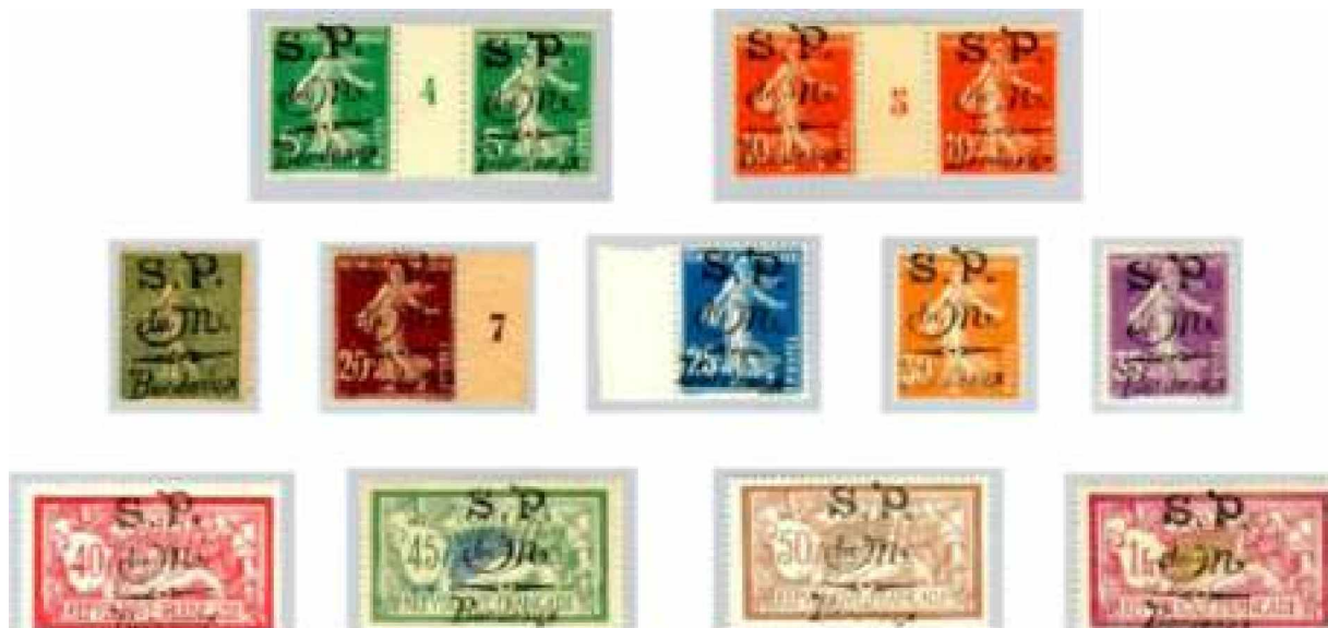
Bild 10 Dienstmarken der Exilregierung Bordeaux

In dem Bestreben nach eigenen Postwertzeichen hatte man auch eine Anzahl französischer Briefmarken von der Post erworben und diese mit einem Kontrollstempel »S. P. du M. Bordeaux« überdruckt (Bild 9). Sie waren für den Schriftverkehr der montenegrinischen Dienststellen in Frankreich vorgesehen, dienten vor allem aber dem Verkauf an Händler und Sammler.