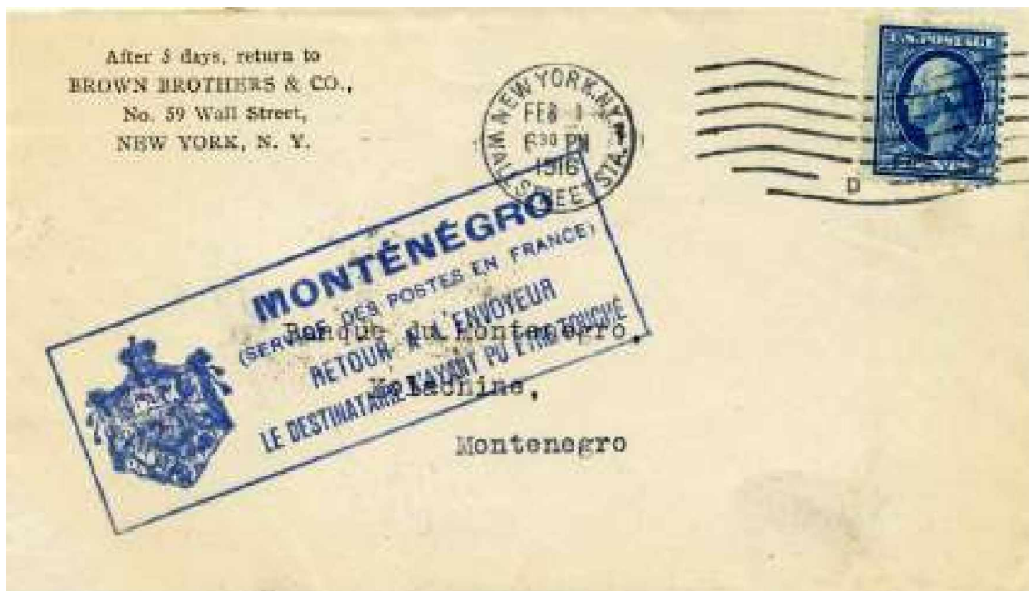
Bild 5 Rückgesandter Brief aus New York vom 1. Februar 1916

Als die Klebezettel aufgebraucht waren, ging man dazu über, einen großen Gummistempel zu verwenden. Damit gekennzeichnete Briefe zeigen die Bilder 5 und 6.