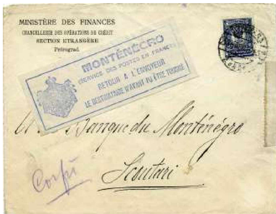
Bild 7 Brief aus Petrograd, der Russland mit rückseitigem Stempel vom 16. Januar 1916 verlassen hat

Auch wurden Klebezettel mit diesem Stempel hergestellt, obwohl dafür kein unbedingter Bedarf vorhanden war, da der Stempel meist direkt auf die Postsendungen aufgeschlagen werden konnte. Höchstens für sehr dunkle Umschläge wäre ein solcher Klebezettel angebracht gewesen. Vermutlich hat man aber, um die postalische Verwendung zu dokumentieren, einen Teil der Post mit solchen Aufklebern versehen. Bild 7 zeigt eine solche Verwendung. Der Brief aus Russland passt in die Zeit, ob er aber wirklich über Bordeaux gelaufen ist und dort seinen Aufkleber erhalten hat, lässt sich nicht mit Gewissheit sagen. Es ist der Einzige mit Gummistempel-Klebezettel versehene Brief, der dem Autor zur Kenntnis kam.