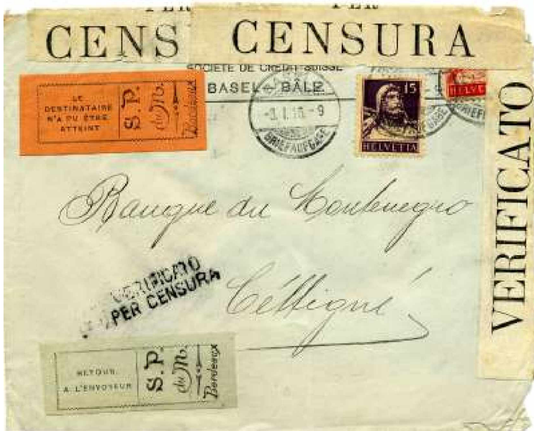
Bild 4 Rückgesandter Brief aus Basel vom 3. Januar 1916

Unbestellbare Post wurde dagegen als solche gekennzeichnet und zurückgesandt. Hierzu dienten zwei Klebezettel mit der Aufschrift »S. P. du M. Bordeaux« und »LE DESTINAIRE N'A PU ÊTRE ATTEINT« bzw. »RETOUR A L'ENVOYEUR«. Einen derartig gekennzeichneten Brief zeigt Bild 4.