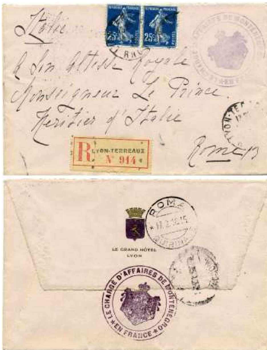
Bild 1 LE CHARGE D'AFFAIRES DE MONTENEGRO EN FRANCE Vorder- und Rückseite eines Einschreibens aus Lyon vom 15.2.1916 an den Kronprinzen von Italien

Der König wollte als Aufenthaltsort die Stadt Lyon, in der Nähe der Schweizer Grenze wählen, wo er sich auch zunächst niederließ (Bild 1).