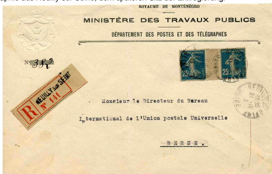
Bild 13 Einschreibebrief des Außenministeriums vom 21.10.1918 an den Weltpostverein in Bern

Nach dem 27. Juni 1916 verwendeten die montenegrinischen Exilbehörden nur noch unüberdruckte französische Marken für ihre Post. Ein Beispiel ist der Brief der montenegrinischen Abteilung für Post und Telegraphie aus Neuilly sur Seine, dem späteren Sitz der Exilregierung.