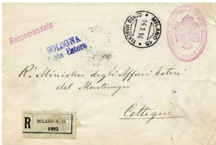
Bild 3 Einschreiben aus Milano (14. 1. 1916) an das montenegrinische Außenministerium

Ein Beispiel für die wenigen, jetzt in Bordeaux zustellbaren Briefe zeigt Bild 3.